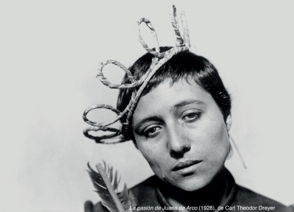
La pasión de Juana de Arco (1928), de Carl Theodor Dreyer